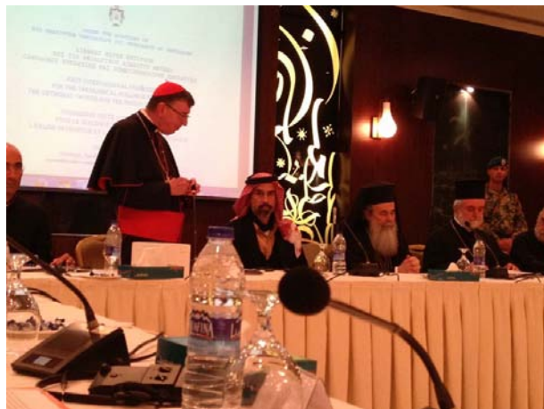
Amman 15-23 septembrie 2014